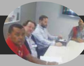
Registros da reunião com direção da LATAM Créditos: Direção SNA