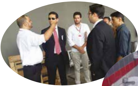
Registros da Operação Conjunta em Brasília