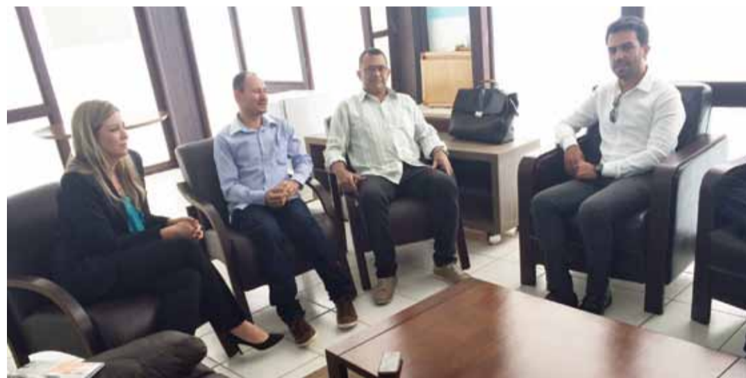
Diretor e presidente do SNA participam de reunião com a Gol