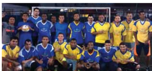
Rio de Janeiro (RJ)