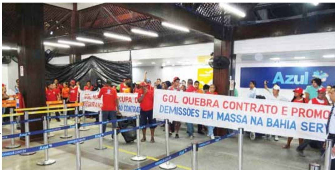
Paralisação encerrou atividades no check-in