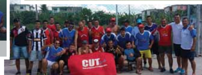
João Pessoa (PA)