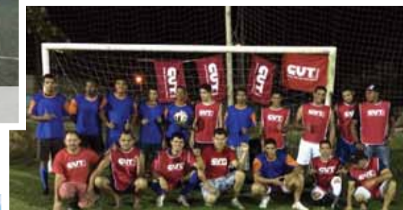
Porto Seguro (BA)