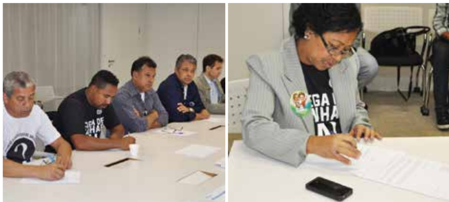
Sindicatos cutistas da aviação durante primeira rodada da Campanha Salarial

O início das negociações da Campanha Salarial é marcado pelo esclarecimento das pautas de reivindicações apresentadas pelas categorias de aeroviários e aeronautas, há aproximadamente um mês. A rodada foi realizada no dia 22 outubro, na nova sede do SNEA (Sindicato Nacional das Empresas Aéreas), em São Paulo.