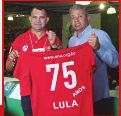
Debate contou com a contribuição do ex-presidente Lula