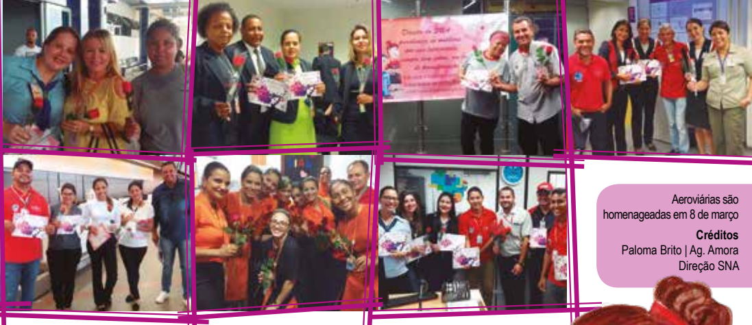
Aeroviárias são homenageadas em 8 de março Créditos Paloma Brito | Ag. Amora Direção SNA

Confira todas as fotos no site www.sna.org.br