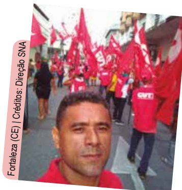
Fortaleza (CE)