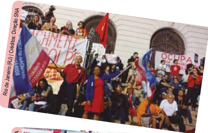
Rio de Janeiro (RJ)