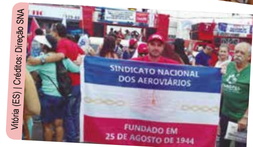
Vitória (ES)