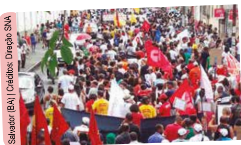
Salvador (BA) | Créditos: Direção SNA

Centrais sindicais se uniram em um grande ato à nível nacional contra a reforma trabalhista e previdenciária proposta pelo governo de Michel Temer (PMDB), no dia 15 de março. Paralisações e manifestações foram realizadas em todo o país. E a direção do SNA (Sindicato Nacional dos Aeroviários) não podia deixar de integrar o movimento. Além de participarem dos atos organizados pela centrais, dirigentes distribuíram nos aeroportos panfletos que alertam sobre os danos que a reforma causará à classe trabalhadora.